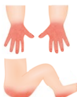
Popálenina od násilného ponoření do horké vody ( ostré ohraničené okraje )