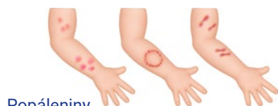
Popáleniny od cigarety