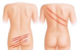
Otisky po bití rákoskou, opaskem