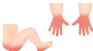
Popálenina od násilného ponoření do horké vody (ostré ohraničené okraje)