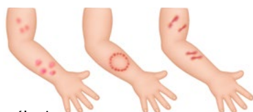
Popáleniny od cigarety