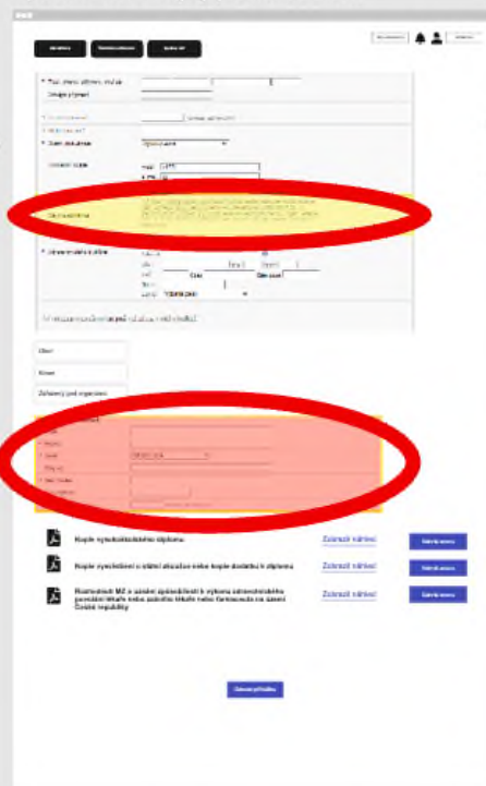
Upozornění na chyby před odesláním