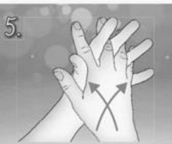
5. Dejte ruce k sobě dlaněmi. Zaklesněte prsty. Třete dlaněmi o sebe ze strany na stranu.