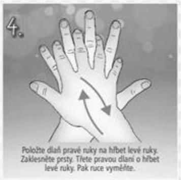
4. Položte dlaň pravé ruky na hřbet levé ruky. Zaklesněte prsty. Třete pravou dlaně o hřbet levé ruky. Pak ruce vyměňte.