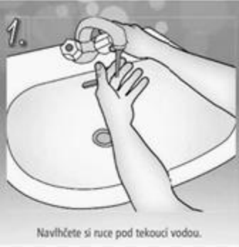
1. Navlhčete si ruce pod tekoucí vodou.