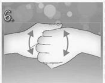
6. Zaklesněte ohnuté prsty do sebe. Třete hřbet prstů pravé ruky o dlaň ruky levé a naopak.