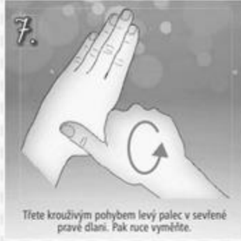
7. Třete krouživým pohybem levý palec v sevěné pravé dlaně. Pak ruce vyměňte.