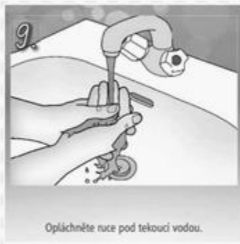
9. Opláchněte ruce pod tekoucí vodou.