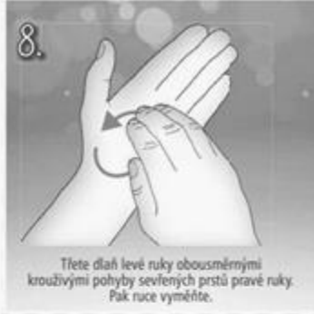
8. Třete dlaň levé ruky obousměrnými krouživými pohyby sevřených prstů pravé ruky. Pak ruce vyměňte.