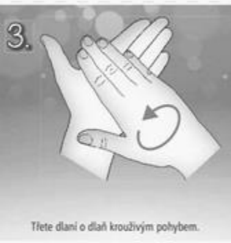
3. Třete dlaně o dlaně krouživým pohybem.