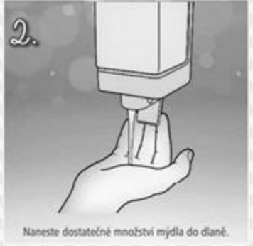
2. Naneste dostatečné množství mýdla do dlaně.