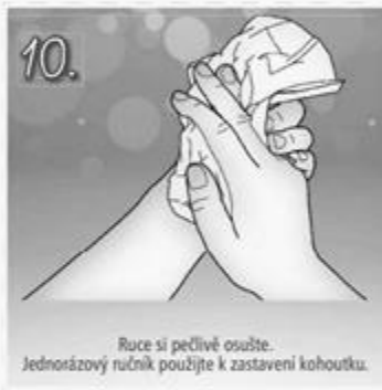
10. Ruce si pečlivě osušte. Jednorázový ručník použijte k zastavení kohoutku.