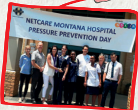
Pretoria, Jihoafrická republika