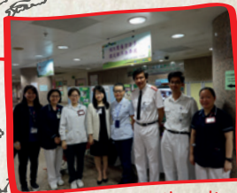
Kowloon, Hong Kong