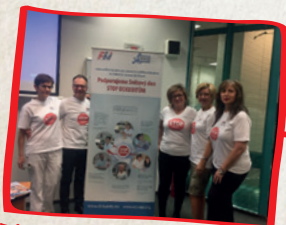
Plzeň, Česká republika