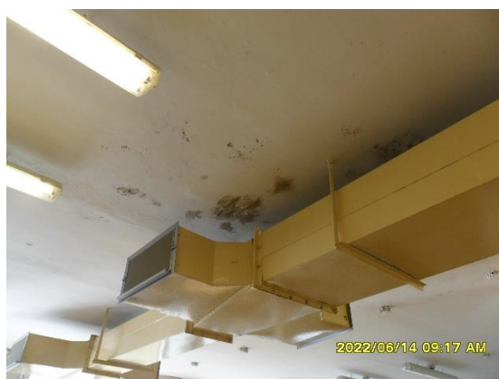
Foto č. 3 Ohniskový výskyt plísně na stropu v kuchyni