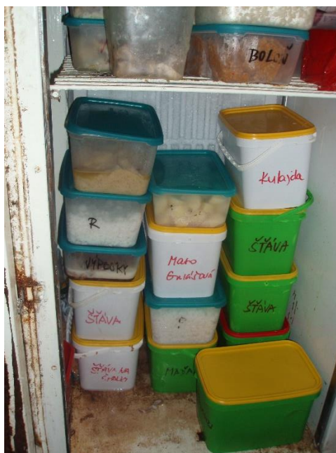
Foto č. 2 Skladování hotových pokrmů v nevhovujícím chladicím zařízení, nedostatečné značení pokrmů a poškozené povrchy zařízení