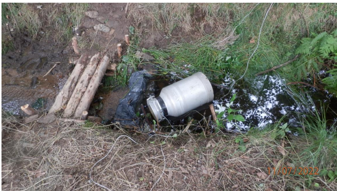
Foto č. 7 Hygienický nedostatek – uskladnění másla v netěsnící nádobě v potoce