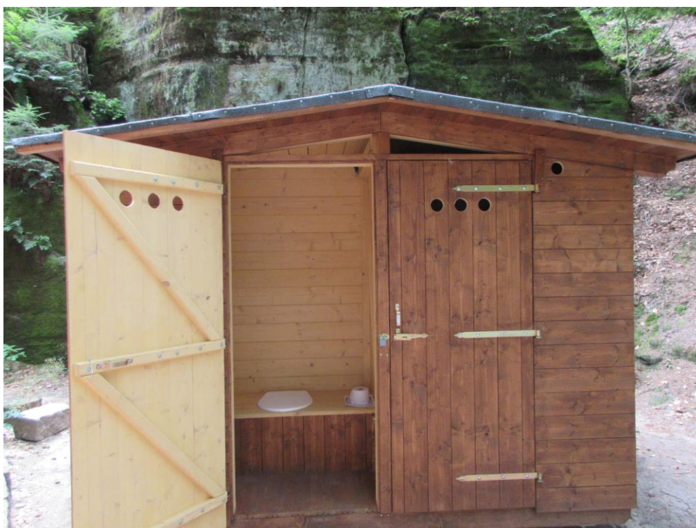
Foto č. 6 Suché záchody