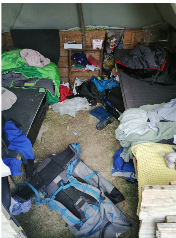
Foto č. 8 Hygienický nedostatek – příklad ubytování dětí ve stanu