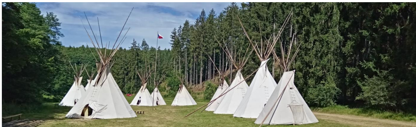
Foto č. 1 Stanový tábor