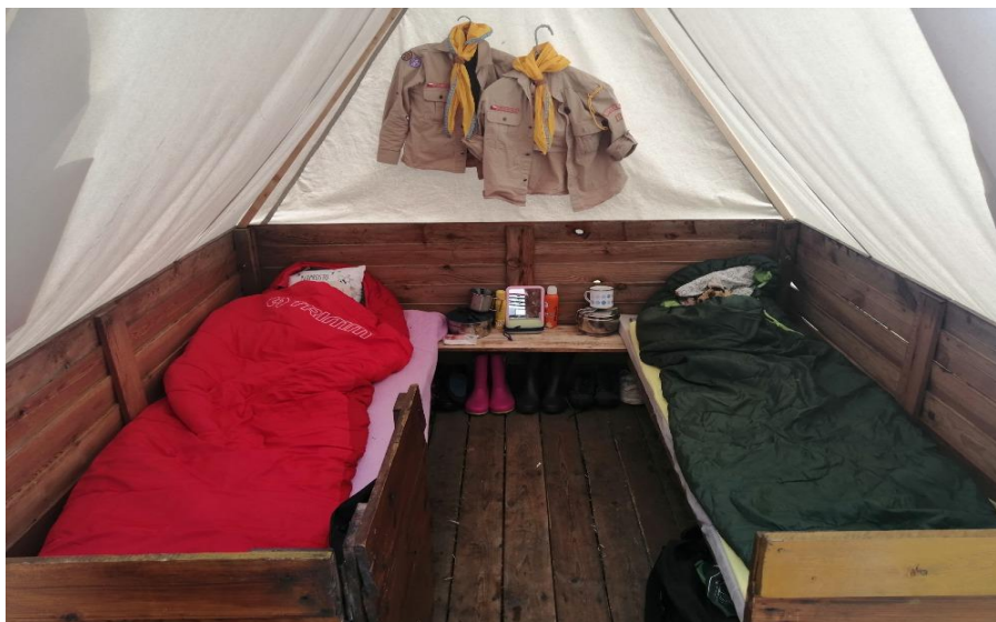
Foto č. 2 Ubytování ve stanech