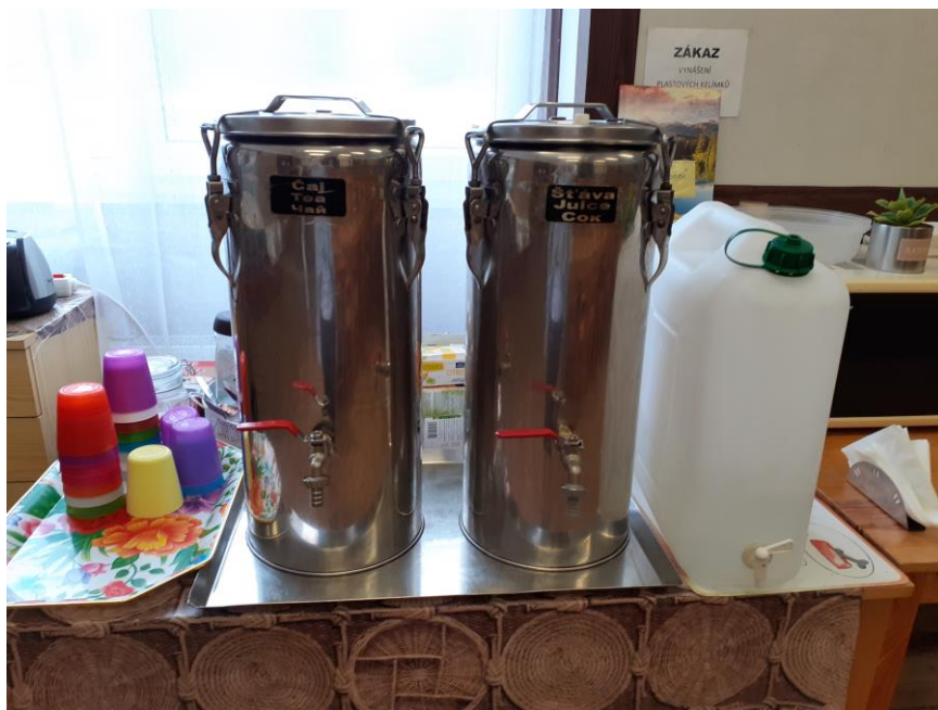
Foto č. 5 Zajištění pitného režimu